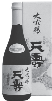
泰山金剛經から集字した「天寿」

この文字が残されている中国山東省・泰山は、約二千年にわたり、秦の始皇帝をはじめ、歴代の皇帝が「封前の儀」(国家統一を天に報告し、天下泰平を感謝する儀式)を執り行った場所である。その泰山の中腹、経石峪と呼ばれる谷間の緩斜面に「泰山金剛經」が刻されている。書体は隸意を帯びた楷書体で、一字の大きさは四〇〜五〇センチにもなる。二七九九字の金剛般若経を刻したものであるが、古意に溢れ、大字刻経として真っ先に思い浮かべられる傑作である。現在は摩滅がはげしく、約九〇〇字が判読できる状態であるが、粗野な線の肌が野趣に富み、朴訥なムードをかもしだしている。 技巧を駆使せず、力を誇示しなくても存在感を示す。そんな書の極意を感じさせてくれる古典である。